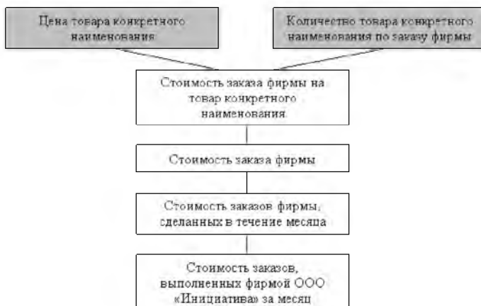
Рисунок 2 – Неформализованное описание решения задачи

В отчете по практической части алгоритм решения задачи (преобразования входной информации в выходную) может быть представлен в виде неформализованного описания (рисунок 2) и соответствующего этому описанию алгоритма решения задачи (рисунок 3).