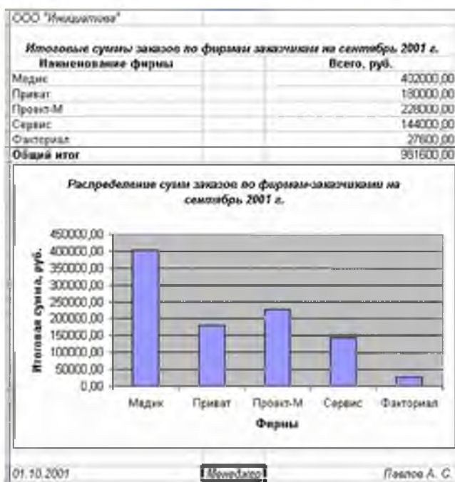
Рисунок 7 – Сводная таблица и графическое представление результатов вычислений